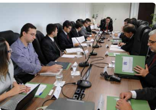
Procuradores de Estado discutiram assuntos de interesse comum ao trabalho realizado pelas Procuradorias

Procuradores de todo o Brasil reuniram-se, no dia 24 de setembro, no Fórum Nacional das Procuradorias Gerais dos Estados e do DF, em