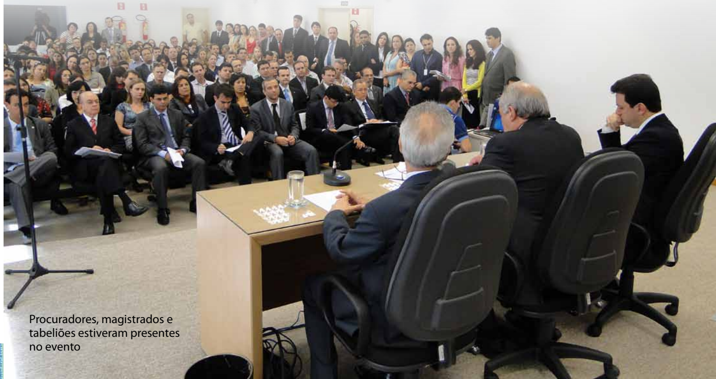
Procuradores, magistrados e tabeliões estiveram presentes no evento