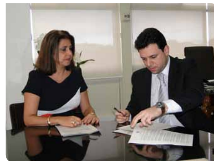
Convênio foi assinado para agilizar os trabalhos da PGE junto ao TRT-ES